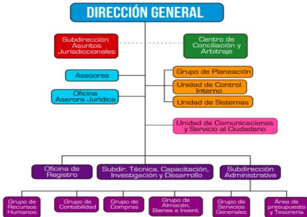
Grafica No. 1 Organigrama de la DNDA