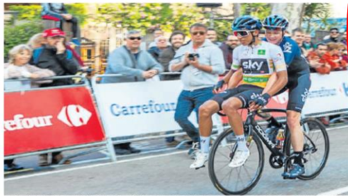
EL COLOMBIANO EGAN BERNAL sostuvo el tercer lugar en la Vuelta a Cataluña, a pesar de un problema mecánico. Cruzó la meta con la bicicleta cargada y luego su compañero Chris Froome lo llevó en la suya hasta el bus del equipo.

E l zapaqueño Egan Bernal tuvo que cargarse su bicicleta al hombro para poder terminar la quinta etapa de la Vuelta a Cataluña ayer, tras sufrir un percance mecánico en los últimos kilómetros de la fracción disputada entre Puigcerdá y Sant Cugat del Valles. Al final, hasta se le vio compartiendo bicicleta con el cuatro veces campeón del Tour de Francia, Chris Froome, en la que fue la imagen curiosa de la jornada. Froome lo llevó hasta el camión del equipo Sky tras finalizar la etapa. Sin embargo, el inconveniente durante la fracción no le causó problemas en la clasificación general, pues sucedió en los últimos tres kilómetros, por lo que el reglamento mantiene el tiempo con el que venía antes del problema.