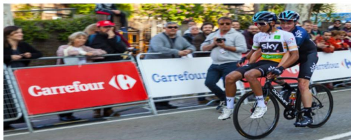
(Chris Froome también ayudó a Bernal.)

La etapa no tuvo demasiadas complicaciones ni cambios en la general, que lidera el colombiano Miguel Ángel López. Pero su compatriota Álvaro Hodeg (Deceuninck-Quick Step) se quedó cortado en la subida a la Collada de Toses (1ª categoría), único gran obstáculo montañoso de la etapa, y se retiró igual que Axel Domont (AG2R La Mondiale).