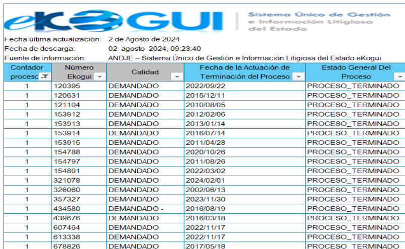
Imagen 4. Procesos Terminados eKOGUI